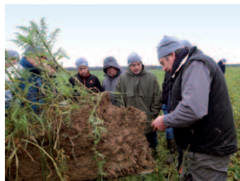
Observer l'impact d'un couvert sur le sol et sur la réduction des phytos